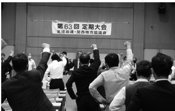
関西地協の仲間が一致団結してガンバろう！

より親密な関係を築き、時代即した新しい組合組織を創っていくことを決意しました。関西地協の全組織の増勢実現に向け、組合員に寄り添うことを基軸に関西地協のすべての仲間とともに、諸課題を実現させるため、一致団結して全力で奮闘することを決