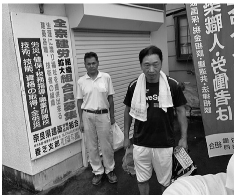
支部事務所前で各方面への行動準備

職人さんの姿はありませんでした。大和や積水ハウスなどの垂れ幕が掛かる現場解体整地後の現場2か所や仮枠組立中現場1か所等を見て回りましたが職人さんとの遭遇はありませんでした。帰りに以前からポスターを張ってもらっている建具屋さん