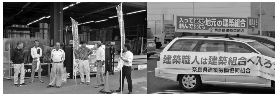
資材館前で支部役員5名が朝宣伝